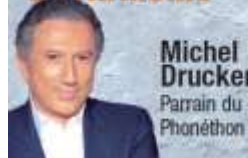
Michel Drucker Patron du Phonéthon