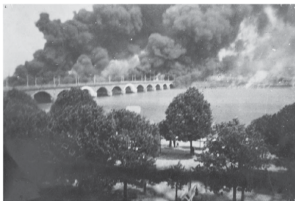
Incendie des quais de Queyries et Deschamps. Août 1944