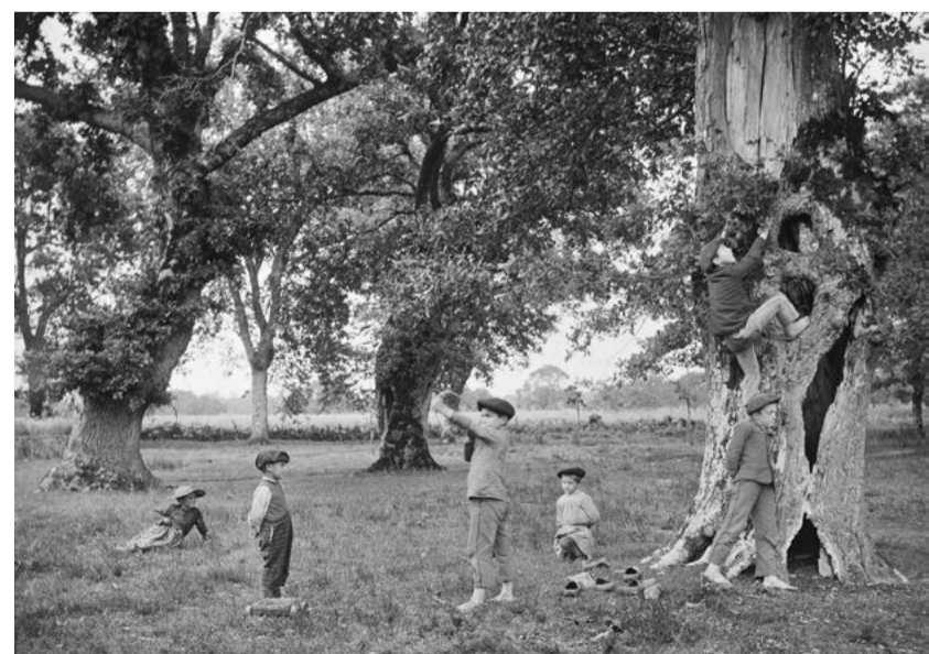
Félix Arnaud, Dénicheurs, Capbat , 1893, coll. Musée d'Aquitaine

Du 13 avril au 31 octobre au musée d'Aquitaine Du 5 mai au 30 juin au Rocher de Palmer, Cenon