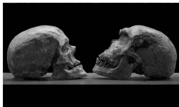
Salle préhistoire, photo L. Gauthier

Visites commentées des collections permanentes, mercredi 14 h 30 4 € / réduit 2€