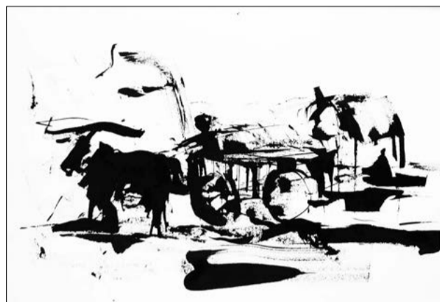
L. Chiffoleau, Char aux algues, encre sur papier, 2014.

Le voyage d'un artiste, du sud de l'Argentine et du Chili, aux confins de la Patagonie. Engendré à l'atelier, comme un voyage homérique, ce parcours est constellé de rencontres, parfois étranges. L'artiste fait la route pour se perdre dans des paysages, des villes et des villages où les images défilent comme les scènes d'un « road movie ».