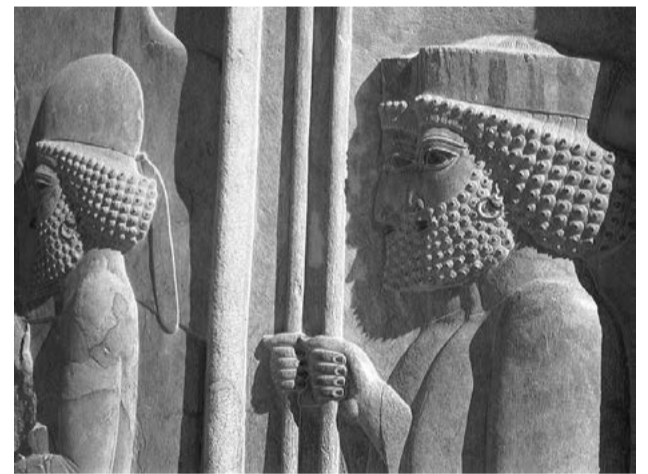
Bas-relief, Persepolis, Iran, P de Rivalora

Situé à l'extrême sud de la gigantesque péninsule d'Arabie, le Yémen est un pays de montagnes. Des montagnes abruptes, séparées par des vallées profondes, mais des montagnes fertiles. Les Yéménites sont donc des montagnards-cultivateurs et des bâtisseurs d'exception : sur les hauteurs les plus inaccessibles ils ont édifié des citadelles d'une stupéfiante beauté dont la perle est Sanaa, la capitale, l'une des plus belles villes du monde.