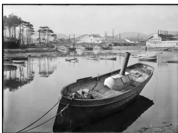
Saint Jean de Luz